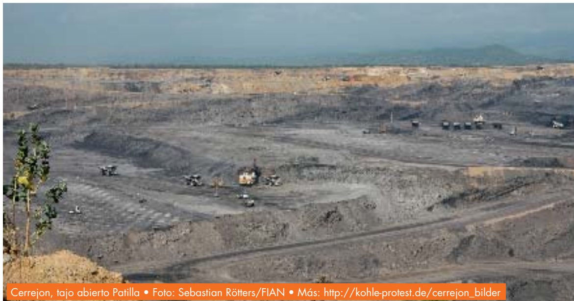
Cerrejon, tajo abierto Patilla • Foto: Sebastian Rötters/FIAN • Más: http://kohle-protest.de/cerrejon_bilder

... Texto 2 Vocabulario • la racha En cualquier actividad, período breve de fortuna o desgracia* • el carbón bituminoso bitumen • el IEEC Instituto de Estudios Económicos del Caribe • clausurar cerrar por irregularidades legales • la gestión actividad, trabajo, empeño • la regalía participación en los ingresos o cantidad fija que se paga al propietario de un derecho a cambio del permiso para ejercerlo* • el pasivo valor monetario total de las deudas y compromisos que tiene una empresa, institución, individuo o estado • esmerado/a hacer algo con mucho cuidado y mucha dedicación • el quinquenio cinco años • neto/a lo que queda después de deducir los gastos